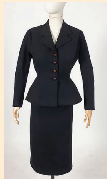
▲ Très rare tailleur en drap de laine noir composé d'une veste à basques matelassées et coupe ajustée à la taille. L'ensemble porte la griffe "Christian Dior Paris" et est numéroté 3889. Estimé 5 000 à 7 000 €.

Attention, il n'y en aura pas pour tout le monde ! Cette vente nocturne réunit une petite centaine de lots, mais ô combien précieux ! En effet, ce vestiaire mondain porte une grande signature : celle de la maison Dior. Maître Valérie Régis proposera quelques modèles iconiques de la marque, de ses origines à aujourd'hui. Les enchérisseurs verront défiler l'une des premières créations de Christian Dior, un ensemble de style new-look de 1947, estimé 5 000 à 7 000 € ; mais aussi une collection de bijoux dessinés par John Galliano en 2004 pour le défilé automne-hiver. La vente couvrira ainsi 70 ans d'histoire de la mode par le prisme d'une des maisons de haute couture les plus prestigieuses !